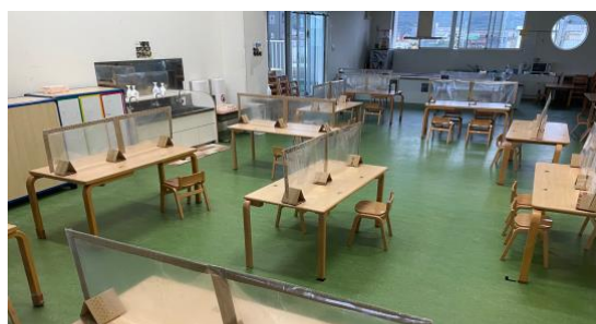
3・4・5歳児の食事のスペース (2階)