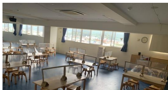
3・4・5歳児の食事のスペース (3階)