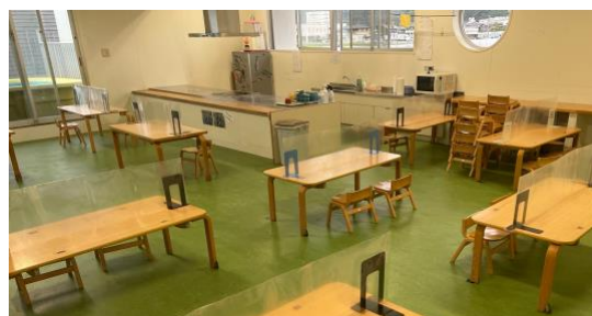
2歳児の食事のスペース